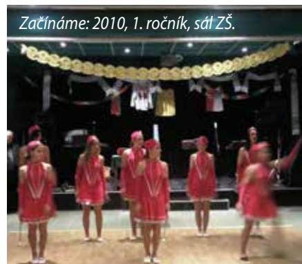
Začínáme: 2010, 1. ročník, sál ZŠ.