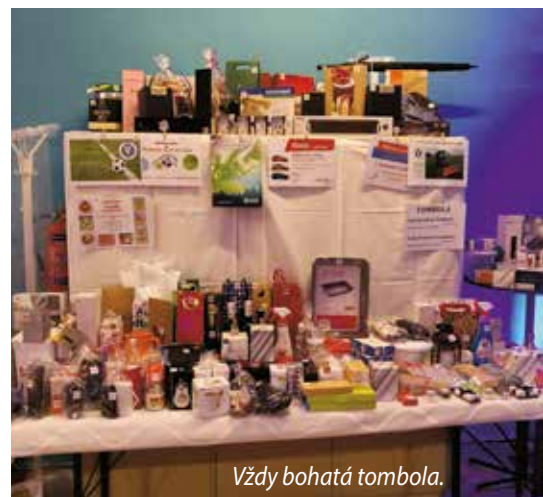
Vždy bohatá tombola.