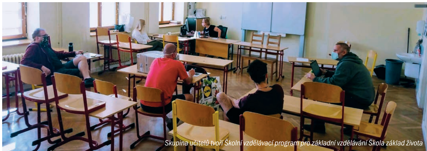
Skupina učitelů tvoří Školní vzdělávací program pro základní vzdělávání Škola základ života

Na pomoc nám přišla ČT 2 s programem UčíTelka, dále existuje na webu edukační program pro žáky, všechno tohle nám pomáhá. V pořadu Toulavá kamera měli diváci za úkol poznat podle obrázku naši dáblíckou hvězdárnu. Žákům, kteří rozhlednu poznali, toto zcela jistě promítnu do závěrečného hodnocení. Žákům jsem také doporučila