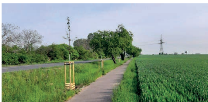
9x třešeň ptačí