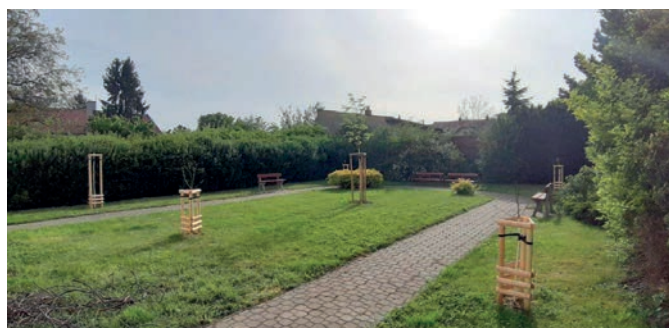
Meruňka, jabloň domácí; třešeň ptačí; hrušeň obecná; slivoň švestka