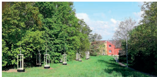
6x javor babyka; 3x dub letní; 3x jeřáb břek; 7x líska obecná; 5x kalina obecná