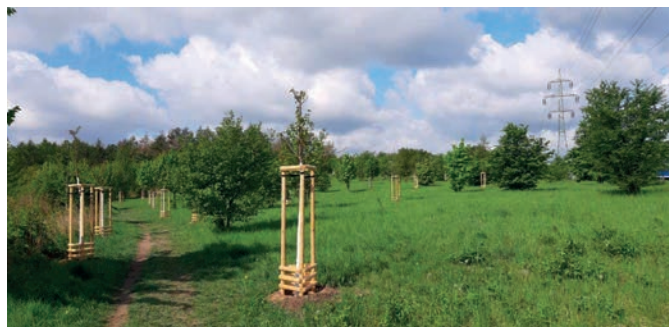
29x třešeň ptačí; 6x ořešák královský