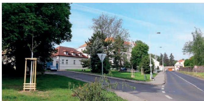
4x lípa velkolistá; 1x trnovník akát; 2x třešeň ptačí