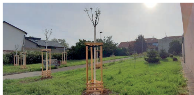
2x jabloň mnohokvětá; 2x jabloň „Rudolph“; 6x slivoň Sargentova