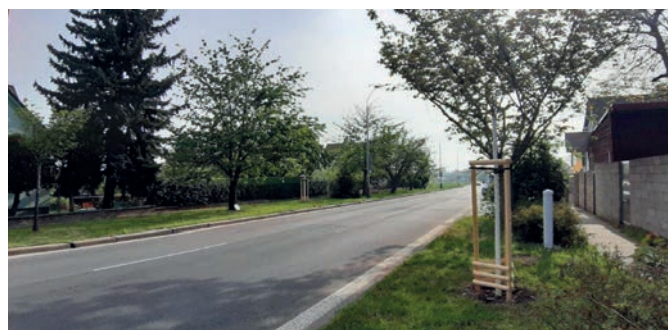
3x třešeň pilovitá