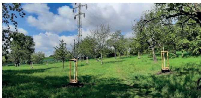
6x třešeň ptačí