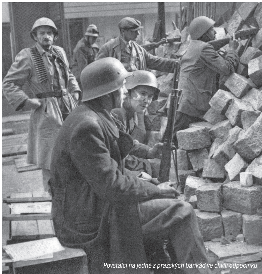
Povstalci na jedné z pražských barikád ve chvíli odpočinku