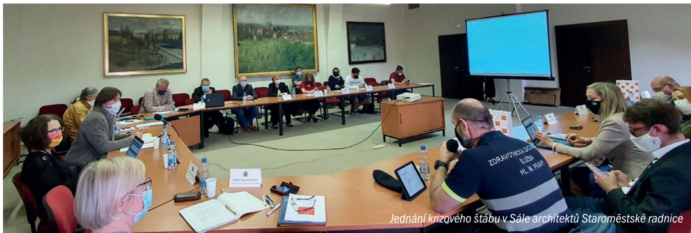
Jednání krizového štábu v Sále architektů Staroměstské radnice