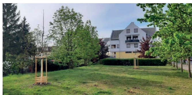
2x morušovník bílý