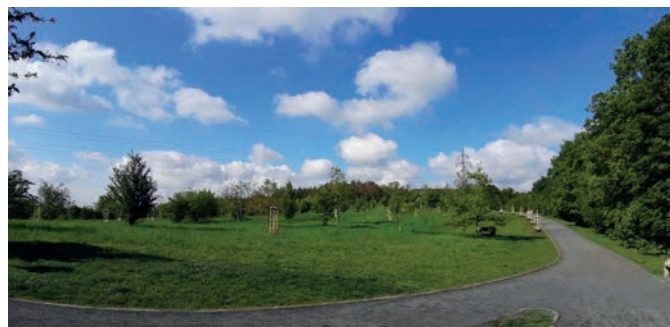
28x třešeň ptačí

O přípravách lokalit pro podzimní výsadbu budeme informovat v prázdninovém čísle.