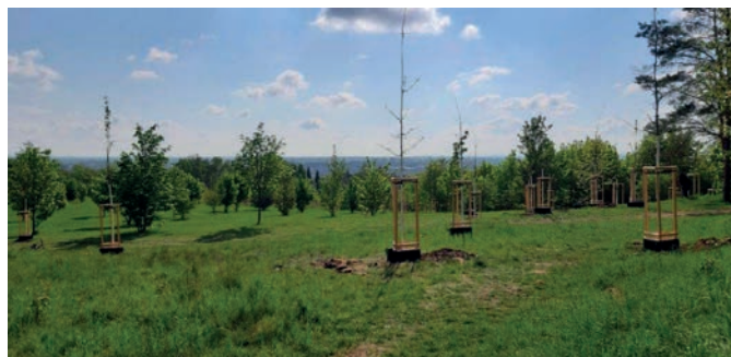
3x dub letní; 5x třešeň ptačí