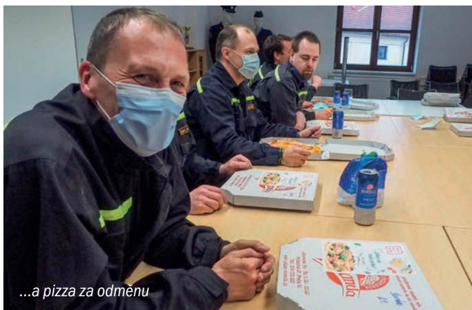
...a pizza za odměnu