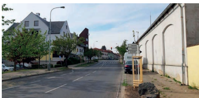
4x třešeň pilovitá; 1x lípa velkolistá; 2x jírovec perleťový