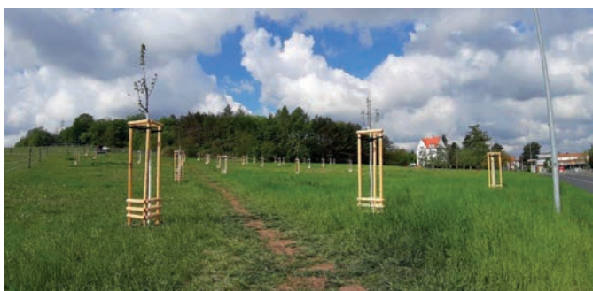
8x ořešák královský; 9x jabloň domácí; 13x třešeň ptačí; 7x hrušeň obecná