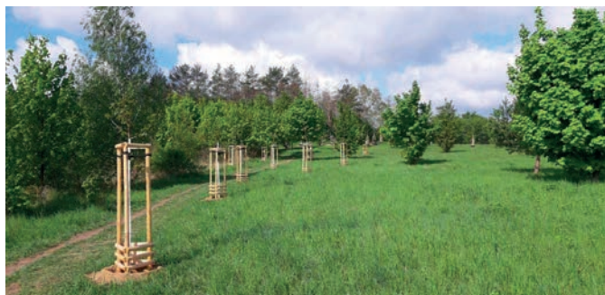
3x javor babyka; 4x dub letní; 4x habr obecný; 3x jeřáb břek; 4x líska obecná; 4x kalina obecná