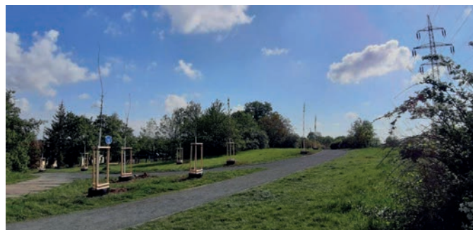
4x dub letní; 10x třešeň ptačí