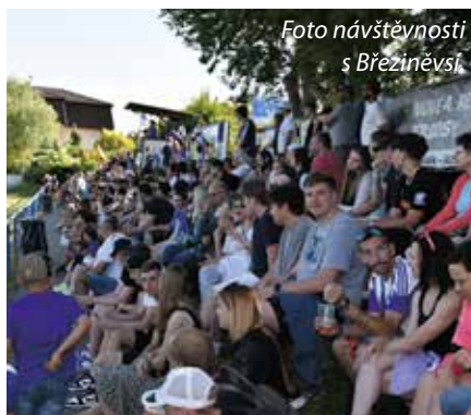
Foto návštěvnosti s Březiněvsí

Na fotbalovém plese jsme zkusili nabídnout občanům, podnikatelům a firmám působícím v Dábllicích projekt sousedského fotbalového turnaje. Osm dábllických týmů nakonec odehrálo ve dnech 20.–21. 6. základní skupinu, ze které do finále postoupily tři týmy. Ty 24. 6. v rámci Dětského a sportovního dne bojovaly o první tři příčky. Krásné zápasy, zajímavá setkání, báječná atmosféra s fanoušky, zcela překvapivé obsazení některých týmů. To vše přinesl první ročník. Předpokládáme a věříme, že tento turnaj bude příští rok/y pokračovat dalšími ročníky.